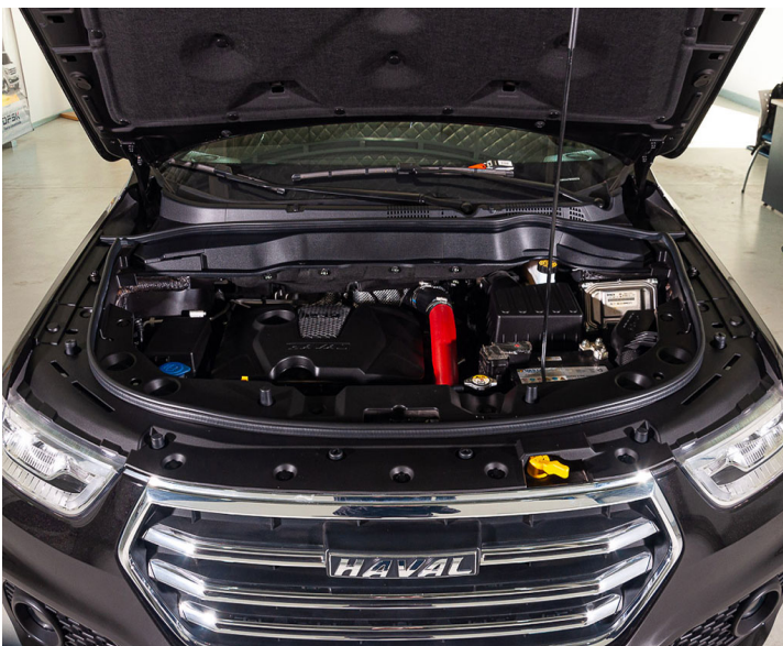
Motor: Realizar mantenimiento preventivo segun esquema indicado por el fabricante