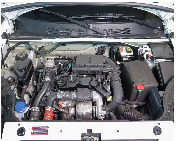
Motor: Realizar mantenimiento preventivo según esquema indicado por el fabricante