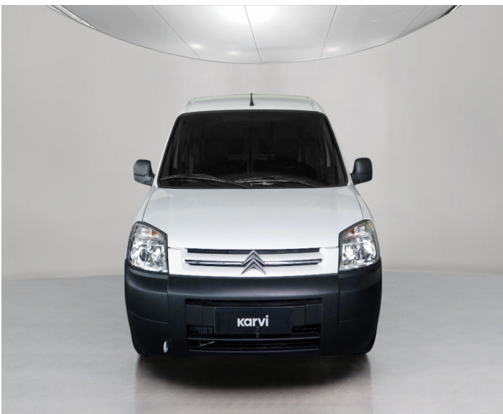
Carrocería: Se sugiere quitar POLARIZADO PARABRISAS porque no es legal