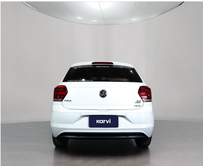
Carrocería: Guardabarros trasero derecho rayado