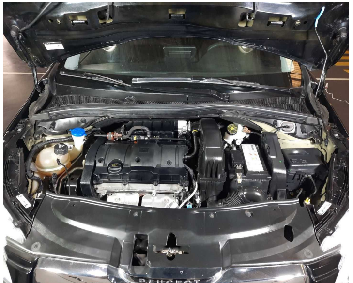
Motor: VTV Vencida.