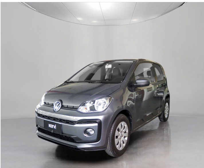
Carrocería: Capot marcado