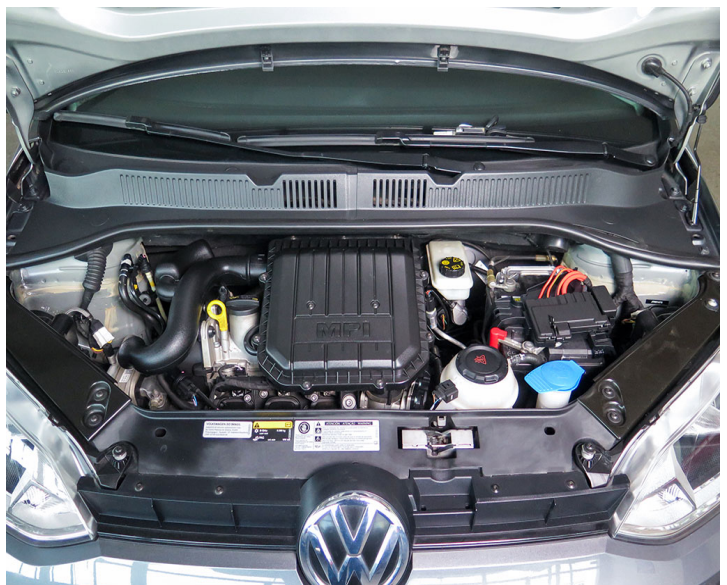
Motor: Realizar mantenimiento preventivo según esquema indicado por el fabricante