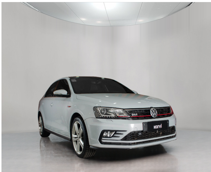
Carrocería: Pequeña marca en capót