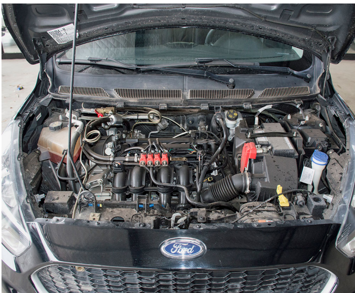
Motor: Oblea GNC vencida. Realizar mantenimiento preventivo segun esquema indicado por el fabricante, cambiar filtro de aire de motor cada 5000km por uso con gnc