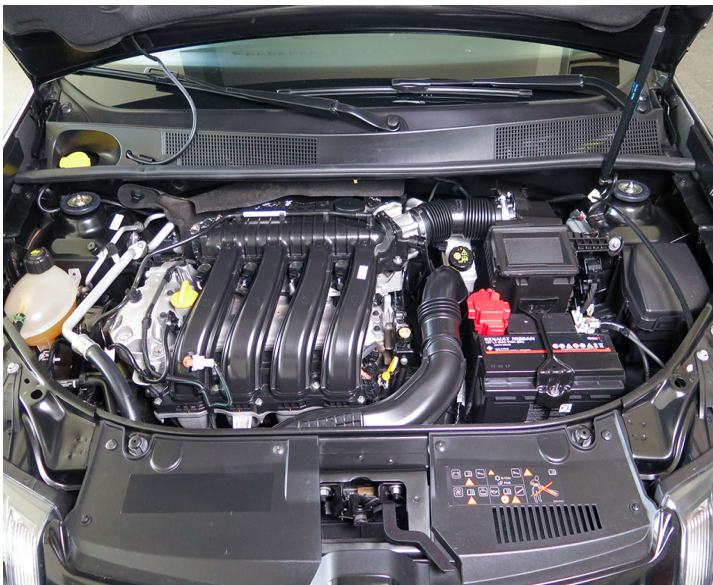
Motor: Realizar mantenimiento preventivo segun esquema indicado por el fabricante