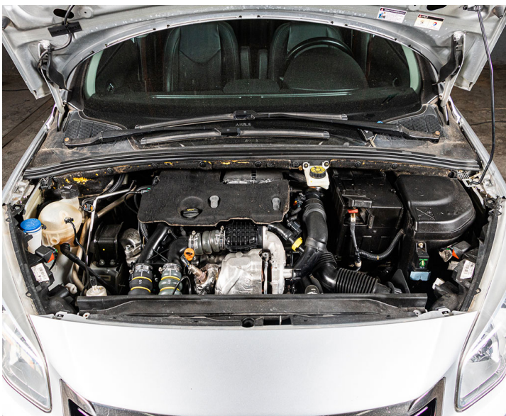
Motor: Completar nivel de liquido refrigerante