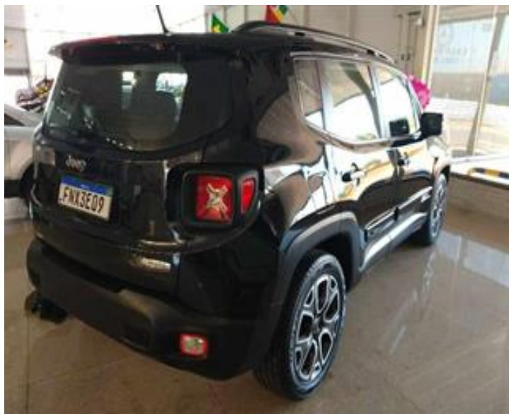
Carroceria: Reparado ou Substituído