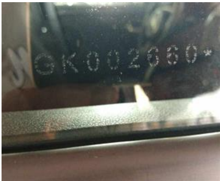
IDV: Vidros Substituídos