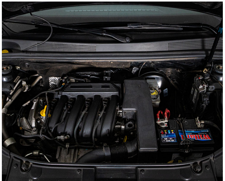
Motor: Recomendación: cambiar filtros de aceite y aire del motor, aceite del motor