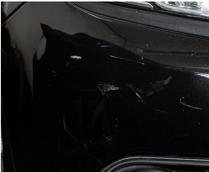
Carrocería: Paragolpes delantero con raspones