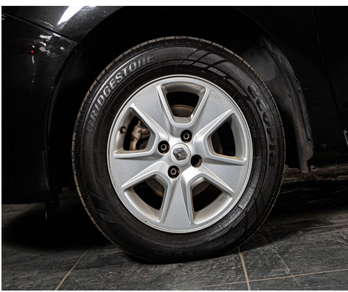
Neumáticos: Neumáticos delanteros nuevos

La información expuesta en este informe fue elaborada por Karvi de forma independiente al titular del vehículo. Karvi no se responsabiliza por la condición del vehículo ni por ninguna de sus partes o piezas. Este informe es de carácter informativo y orientativo sobre la condición del vehículo y no debe utilizarse como documento de ningún tipo ni tiene validez legal para utilizarse en ninguna transacción.