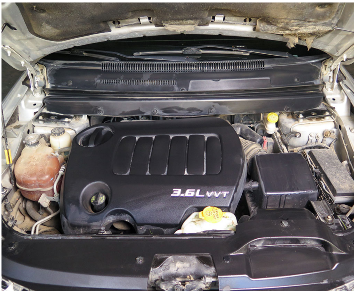
Motor: Realizar mantenimiento preventivo según esquema indicado por el fabricante