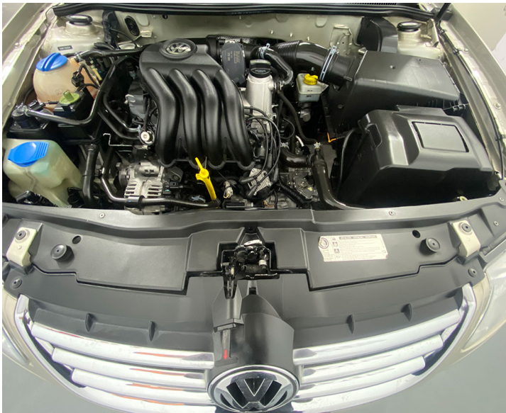
Motor: Realizar mantenimiento preventivo segun esquema indicado por el fabricante