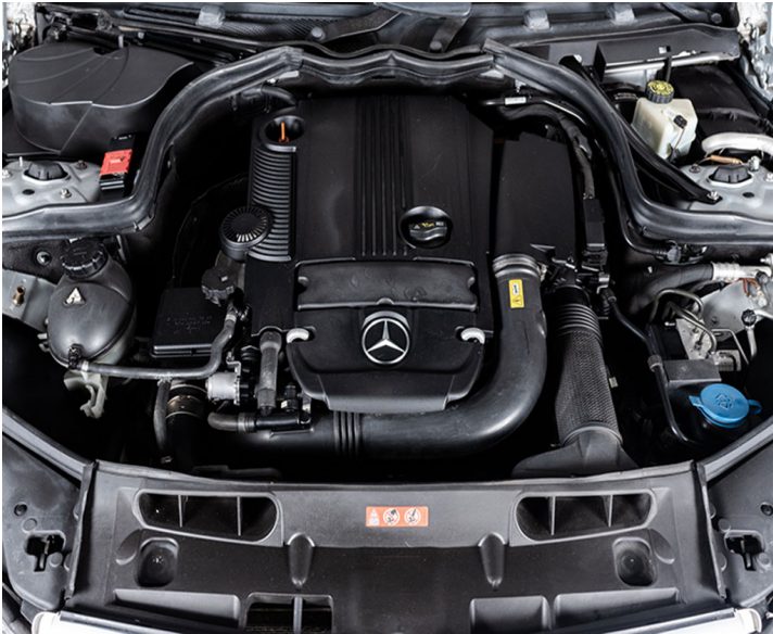
Motor: Recomendación: cambiar filtros de aceite y aire del motor, aceite del motor, correas del alternador.